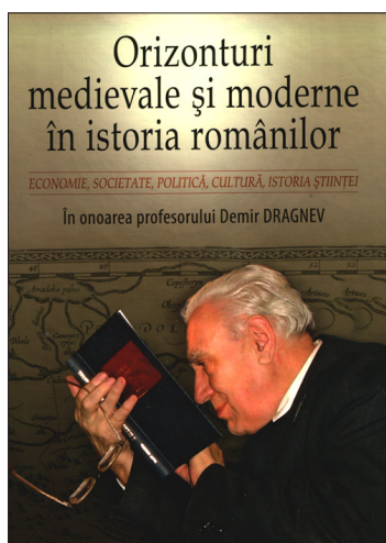
Orizonturi medievale și moderne în istoria românilor (economie, societate, politică, cultură, istoria științei).